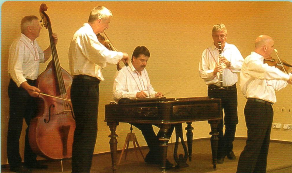
Společenský večer Sjezdu SRFM v Luhačovicích jako každoročně provázela cimbálová muzika.

INFORMACE UNIE FYZIOTERAPEUTŮ ČESKÉ REPUBLIKY 20. ROČNÍK, ČERVEN/2012